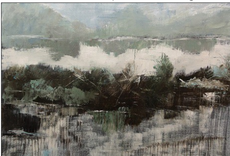
Silvana Franco Pantanal: umida è la terra 2015 olio su tela cm 70x92

Aprono le 86 pagine della pubblicazione l'editoriale di Roberto Speciale e Gianfranco De Ferrari seguito dai testi di Raimondo Sirotti, Luciano Caprile, Giancarlo Pinto così come i commenti di Silvia Ambrosi, Leo Lecci, Carlotta Gualco, Rossella Soro componenti della giuria del concorso e di Andrea Gualco e Silvia Bottaro.